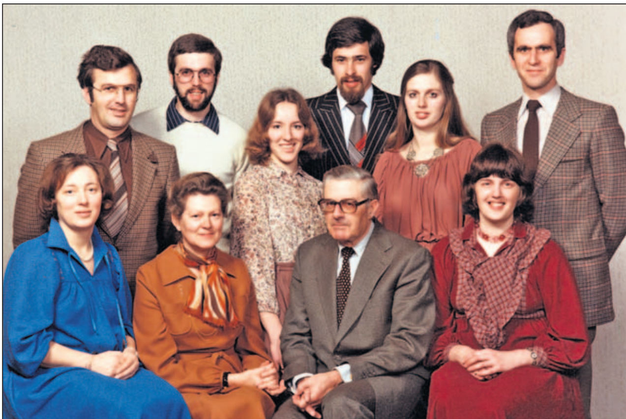
BIJ DE FOTO Een relatie met je broer of zus moet je blijven onderhouden. Ook als volwassenen moet je opnieuw met elkaar in gesprek gaan, de stereotypen uit de jeugd vergeten en niet blijven hangen in oude beelden.

O p 10 april aanstaande is het in Nederland Broers- en zussendag. Voor het eerst. Vaderdag en Moederdag kenden we al, maar wat moeten we ons bij deze dag voorstellen? Initiatiefneemster Minke Weggemans: 'Een broer of zus is een uniek persoon in je leven.'