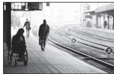
'Krijgen' is in de rolstoel niet het goede woord...